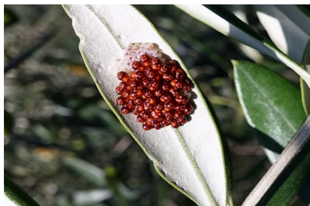
Halyomorpha halys – giovani neanidi su olivo (Carraro)