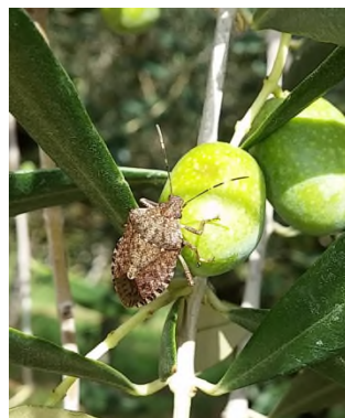
Halyomorpha - adulto su olivo (Carraro)