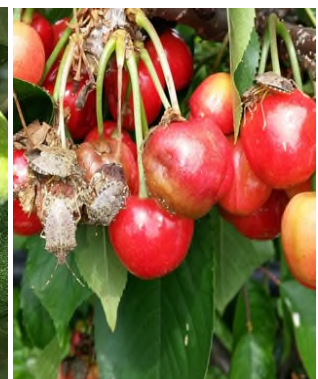
Halyomorpha - adulti su ciliegio (Carraro)