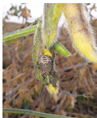
Halyomorpha –ninfà su soia (Carraro)